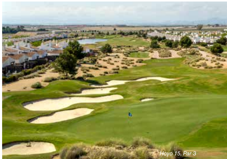
Hoyo 15, Par 3

La ACADEMIA GNK Golf está presente en los cinco de los seis campos, y son de referencia a nivel regional y nacional. Se caracterizan por ofrecer un amplio abanico de productos de enseñanza de golf de la mano de profesores experimentados. Todos los campos cuentan con amplias aéreas para la práctica y la enseñanza del golf: greens de prácticas, zonas de juego corto y amplios driving range para practicar los golpes largos. Para clases en la academia de GNK Golf se requiere cita previa con sus profesionales.