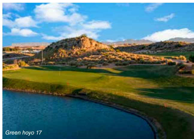
Green hoyo 17

Just 20 km from Murcia and 25 from the Mar Menor on the C-3319 Murcia - San Javier road, we find the exclusive resort El Valle Golf that houses one of the most emblematic courses of GNK Golf, El Valle Golf. An 18-hole par 71 course with undulating fairways between large towers of limestone, making up the striking landscape in which it is located and is what impresses both players and visitors. El Valle Golf in its 11 years of existence has hosted important championships such as: the Spanish Championship of Professionals in 2009 and the European Senior Tour OKI in 2011 as well as many other championships of the Spanish Golf Federation and the Qualifying Stage for the European Tour. Located in this impressive resort, is a golf course, open to the public and one of the most liked within the GNK Golf Circuit.