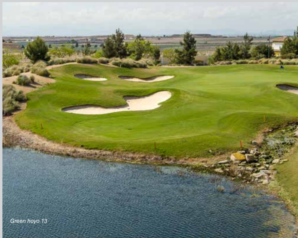
Green hoyo 13