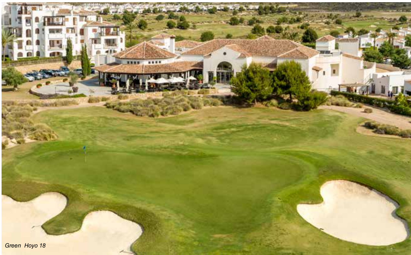
Green Hoyo 18