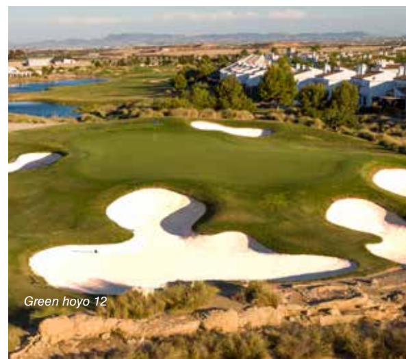
Green hoyo 12

There are courses that leave a mark and El Valle Golf is one of those. Not only because of its Nicklaus design, although it does not bear his signature, as is the case of Alhama Golf, where Nicklaus himself was involved in all the development of the project, but I'm sure "Jack" put his style and wisdom into this design. A very well defined undulating course that contrasts with the desert landscape. The greens, are always raised and are protected by large and intimidating bunkers. El Valle Golf is a course with spectacular views, from anywhere you can enjoy incredible views that transport you to those desert courses of California. El Valle Golf is a course that inspires the player to make the perfect shot, although you have to accept that you may come out with a lower result, because although the course is not very long, 5,634 metres (from the yellow) it requires a lot of technique.