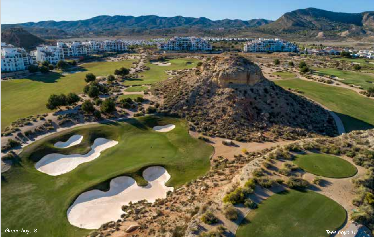
Green hoyo 8