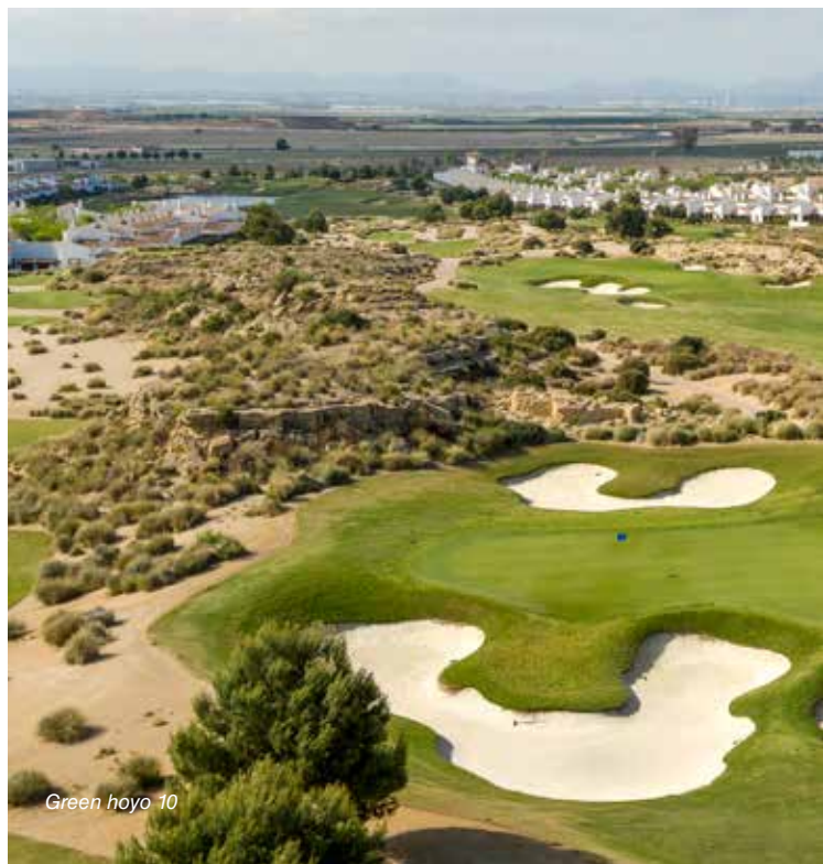
Green hoyo 10

The fairways are perfectly drawn around mountains of limestone rock that are set and integrate harmoniously within the native landscaping.