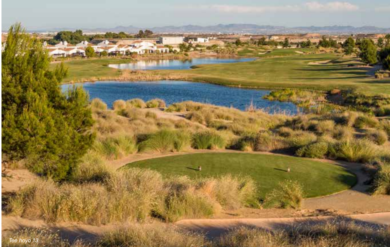
Tee hoyo 13